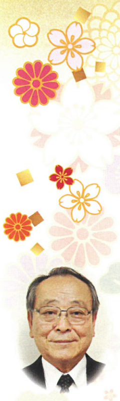
社会福祉法人 池田町社会福祉協議会