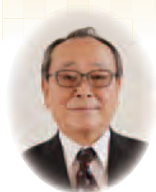
社会福祉法人 池田町社会福祉協議会

結びに、皆様のご健勝とご多幸を心からご祈念申し上げます。新年のご挨拶といたします。