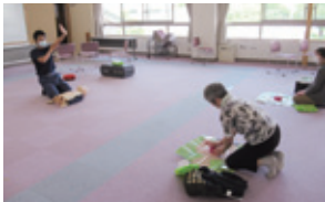
◀「ファミリー・サポート・センター協力会員講習会 子どもの救命方法」