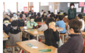
◀会染小学校5年生「アイマスク体験」