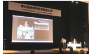
◀“コロナ禍で見つめなおす、人と人とのつながりの大切さ”をテーマに会場同士をオンラインでつなぎ開催しました