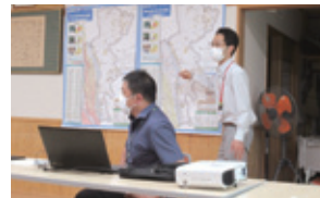
◀「災害福祉カンタンマップ 説明会 4丁目」