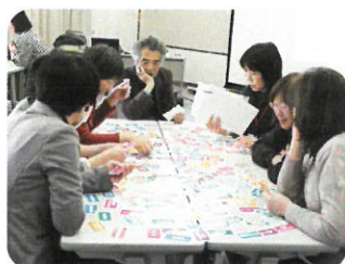
ふれあい・いきいきサロン 情報交換会