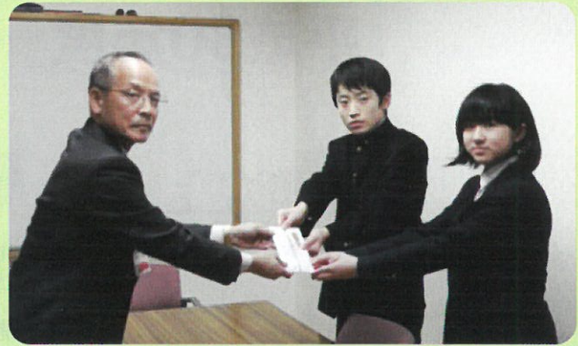
高瀬中学校の皆さん いつもありがとうございます。

以上の方からご寄付をいただきました。 厚くお礼を申し上げます。(H30.2.14~H30.4.13)