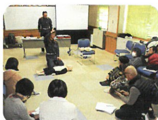
子育てお役立ち講座

各事業の詳細はホームページをご覧ください か、池田町社協までお問い合わせ下さい。