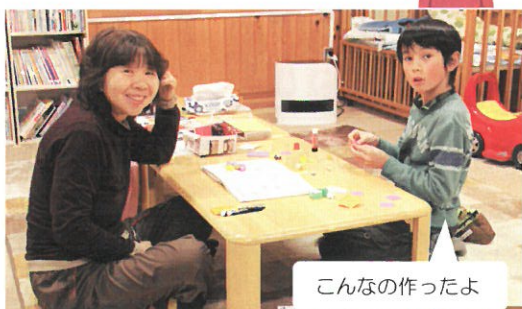
こんなの作ったよ

今、子育て中の人たちに、「子育てにはできるだけ家族以外の他人に関わってもらえるといいよ」と伝えたいです。