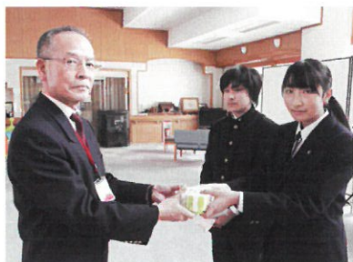
高瀬中学校生徒会 ボランティア委員の皆さん