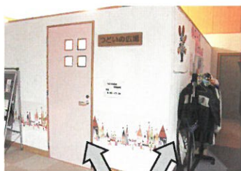
つどいの広場 リユースコーナー